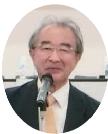
▲衆議院議員 近藤昭一様