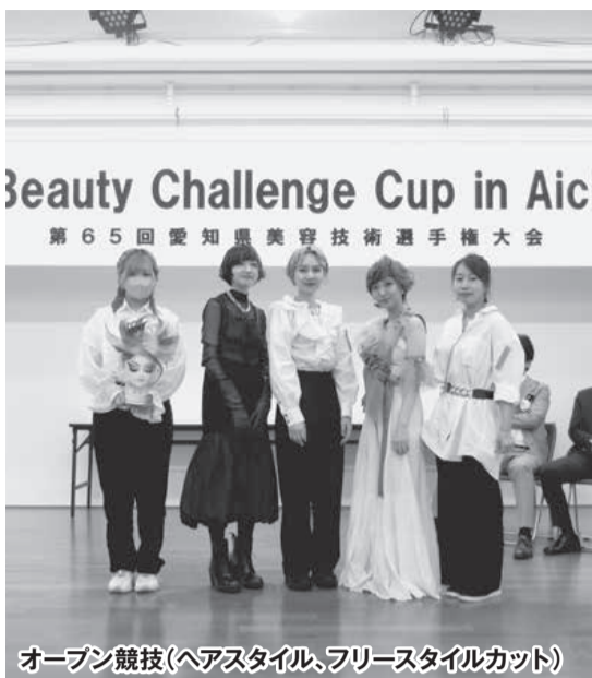
オープン競技(ヘアスタイル、フリースタイルカット)