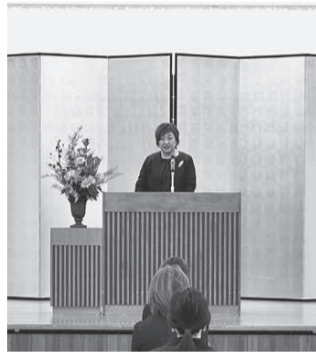
▲名古屋校校長挨拶