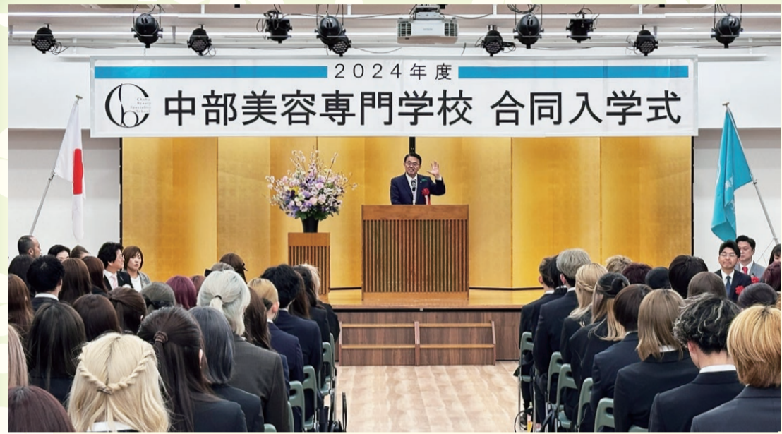
▲愛知県知事からの祝辞

新入生の方々は、 これから始まる学校 生活への期待と不安 を胸に秘めながら美 容学校生としての第 一步を踏み出すこと となりました。