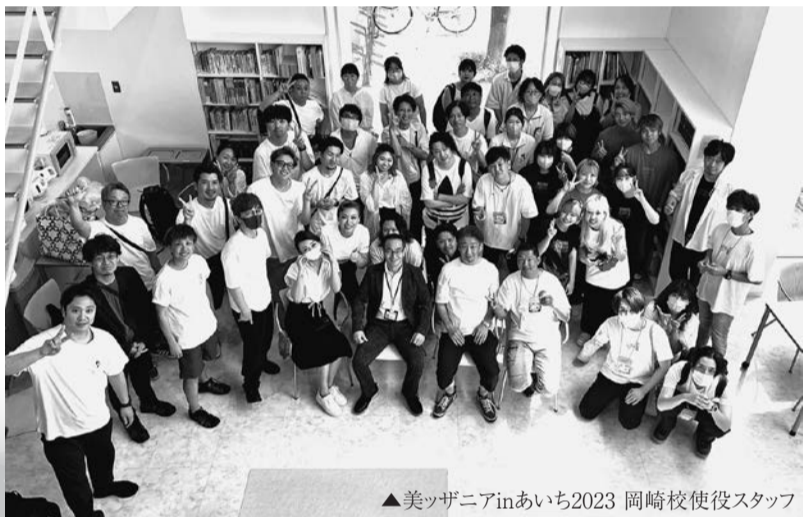
▲美ツザニアinあいち2023 岡崎校使役スタッフ

令和6年、今年は石川県の震災などから始まり、波乱の年明けに驚かれなかった方はいないでしょう。コロナ禍からようやく日々の日常が戻り始め、お客様との会話でも旅行やイベントなどの話題で盛り上がるが多くなりました。今年の青年部も以前のように開催できる企画とそうではないものとの振り分けがございますが美ツザニアなど多くの方にご参加いただけるイベントにおいては毎年大盛況をいただくことができ、青年部一同大変うれしく感じております。様々な企画の開催にあたり青年部幹事の皆様、美容組合関係者の皆様、また、この活動を支え、ご協力いただいております組合員の皆様に感謝をするとともに、先ずは自分たち青年部が楽しく、やりがいを感じる活動がこれからも行っていきたくと思います。