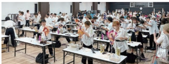
第67回愛知県美容技術選手権大会