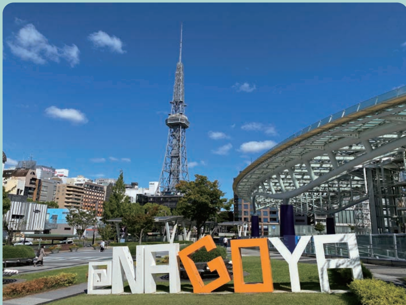
(中部電力 MIRAI TOWERとオアシス21)