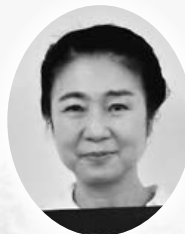
豊田支部 C&Mビューティサロン