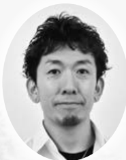
岡崎支部 ゴット イズム