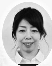
知多支部 ビューティスタジオ・とし