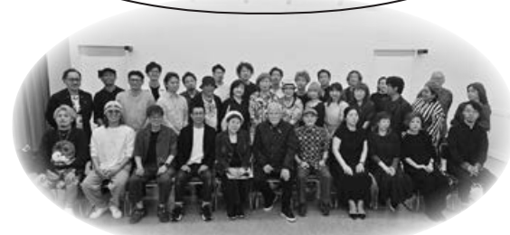
▲認定ライセンス取得セミナー