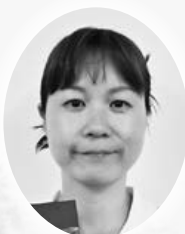
南支部 SK re birth