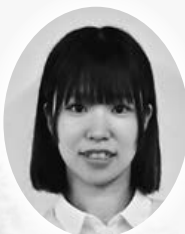
豊川支部 CLEAR'S BEAUTY