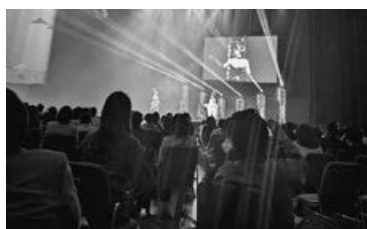
▲全国 TM モード発表会

2024年10月14日 月曜日(祝) 開場13時 開演14時 美容あいち会館 2F クリスタルホール