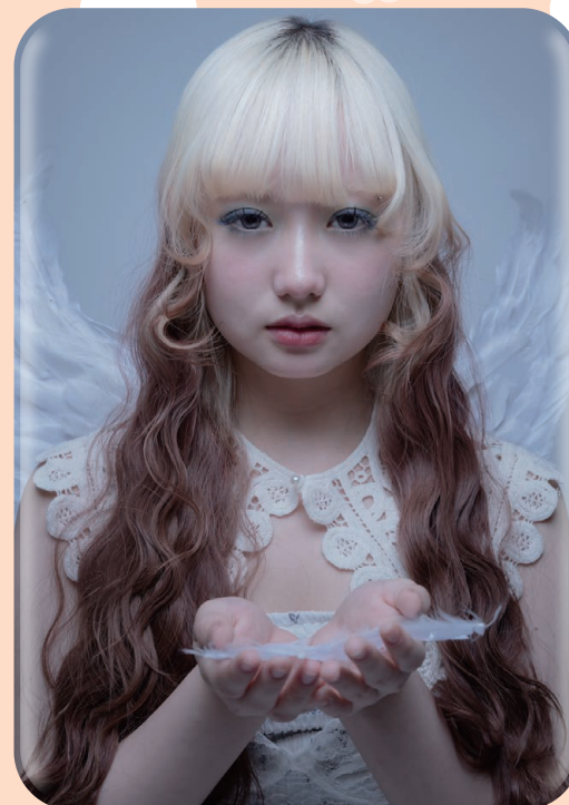
▲フォトコンテスト優勝作品