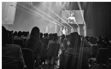
▲全国 TM モード発表会