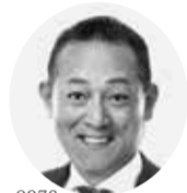
参議院議員 斎藤 嘉隆

〒454-0976 名古屋市中川区服部3-507 TEL: 052-439-0550 FAX: 052-439-0560