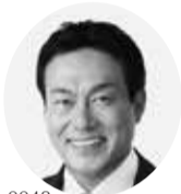
参議院議員 藤川 政人

〒451-0042 名古屋市中区那古野2-23-21 デラ・ドーラ6C TEL: 052-485-8361 FAX: 052-485-8371