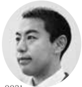
衆議院議員 今枝 宗一郎

〒442-0031 豊川市豊川西町64 TEL: 0533-89-9010 FAX: 0533-65-7020