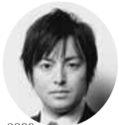
愛知県議会議員 鳴海 やすひろ

〒453-0839 名古屋市中村区長茂町3-48 ラフォーレ中村1階 TEL: 052-433-6655 FAX: 052-433-6625