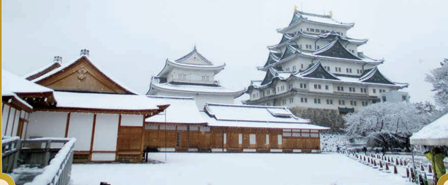
天守閣と本丸御殿と雪