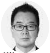
衆議院議員 伴野 豊

〒475-0836 半田市青山2-19-8 アンビシャス青山1階 TEL: 0569-25-1888 FAX: 0569-25-1881