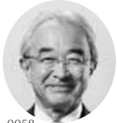
衆議院議員 近藤 昭一

〒468-0058 名古屋市天白区植田西3-1207 TEL: 052-808-1181 FAX: 052-800-2371