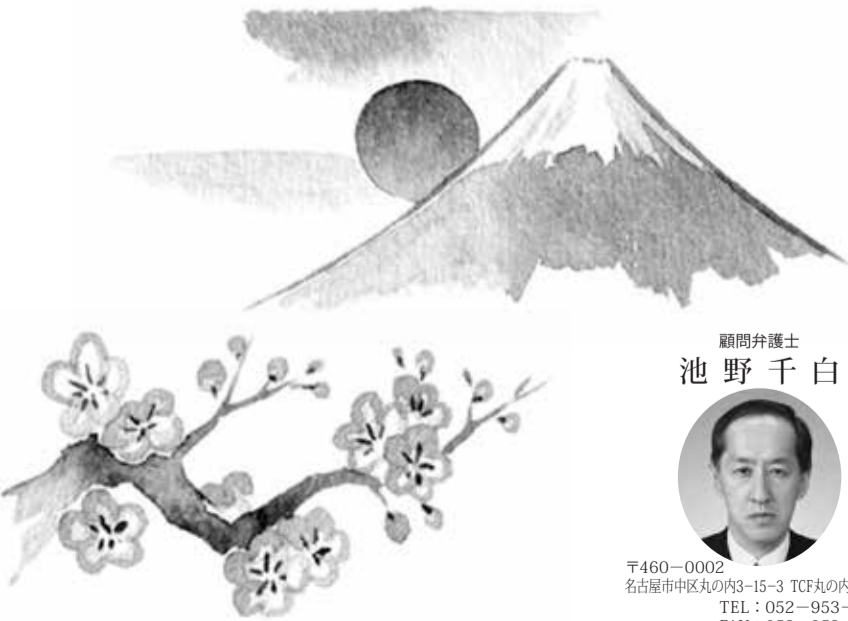
顧問弁護士 池野 千白

〒455-0002 名古屋市中区東通3-170 TEL: 052-661-5778 FAX: 052-661-5560