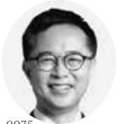
衆議院議員 古川 元久

〒464-0075 名古屋市千種区内山3-8-16 トキワビル2階 TEL: 052-733-8401 FAX: 052-733-6382