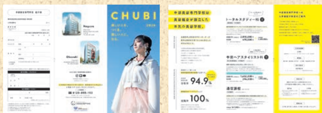
◀ サロン リーフレット

※サロンリーフレットをご入用の方は、学校事務センター(052-323-0011)までご連絡ください。