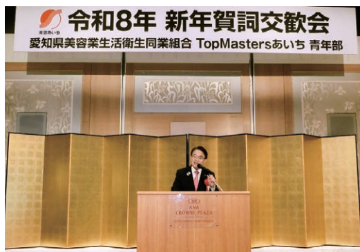
▲愛知県知事の大村秀章様より祝辞