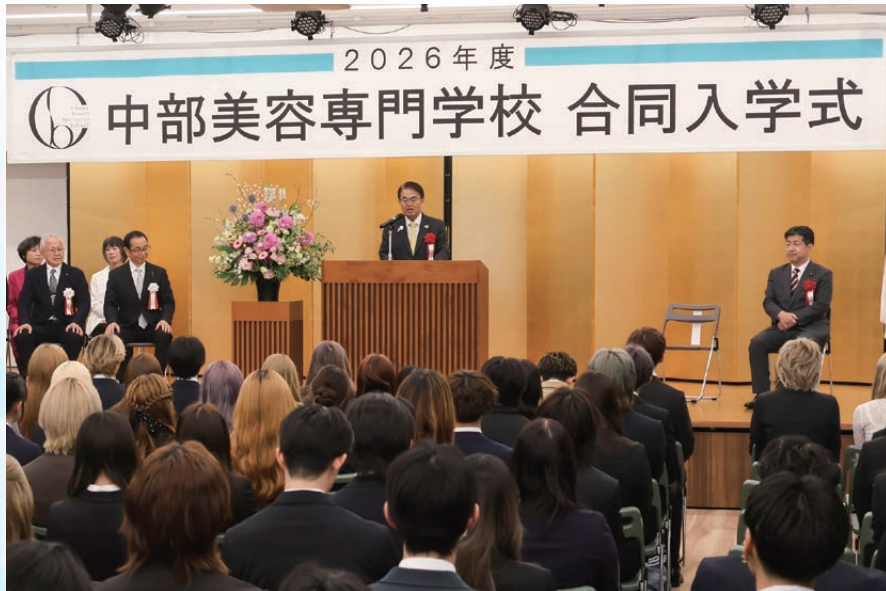
▲愛知県知事からの祝辞

4月6日(月)午前10時 より美容あいち会館2階 クリスタルホールに於いて、 名古屋校・岡崎校合同入 学式が26期トータルスタ ディー科262名、26期