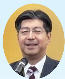
▲参議院議員 里見隆治様